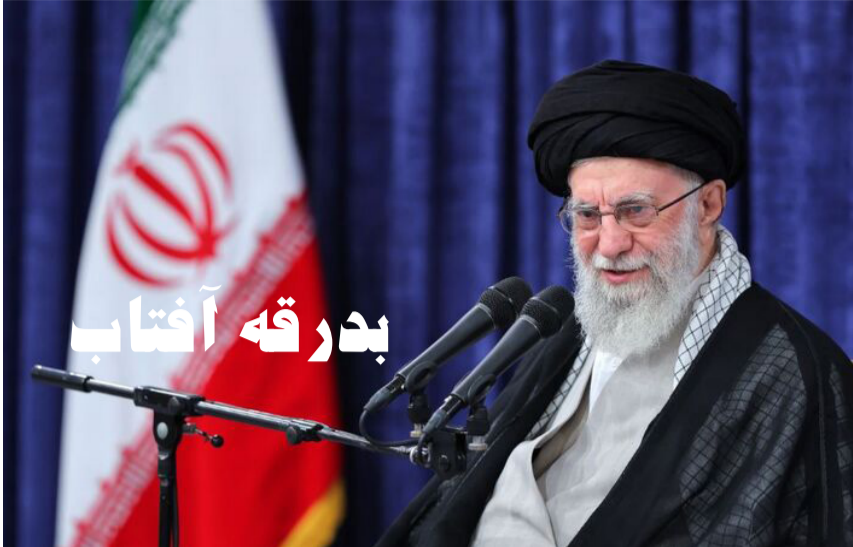
دبیر ستاد ملی آیین تشییع و وداع با رهبر شهید ایران،