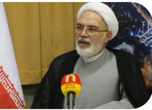
دبیر ستاد اقامه نماز وزارت فرهنگ و ارشاد اسلامی در گفتگو با شبستان:

مراسم تکریم از خانواده‌های معظم شهدا با عنوان «شبی با شهدا در محضر قرآن»، امشب (پنج‌شنبه، ۲۳ اسفندماه) در بخش «مسجد، پایگاه قرآن سی و دومین نمایشگاه بین‌المللی قرآن کریم برگزار شد. در این برنامه، که در بخش «مسجد، پایگاه قرآن» برگزار شد، از خانواده‌های شهدیان مهدی غلمانی، صیغالله و جواد مقدم تجلیل به عمل آمد. آغازگر این آیین نورانی تلاوت آیاتی چند از کلام‌الله مجید توسط قاری نوجوان بود؛ در ادامه گروه سرود بچه‌های مسجد به اجرای برنامه پرداختند که با استقبال حاضران و بازدیدکنندگان مواجه شد. در این مراسم حجت الاسلام و المسلمین علی ملاتوری اظهار کرد: امام خمینی(ره) شهدا و خانواده شهدا را چشم و چراغ ملت می دانستند و بعد از ایشان مقام معظم رهبری، بزرگداشت یاد شهدیان را همانند شهادت ارزشمند می دانند. رئیس ستاد هماهنگی کانون های فرهنگی هنری مساجد کشور بیان کرد: نوجوانان و جوانان عضو کانون های فرهنگی هنری مساجد کشور بیشترین ظرفیت و آمادگی را برای ادامه راه شهیدان دارند. وی تأکید کرد: در دوران دفاع مقدس